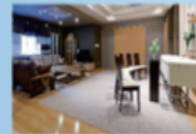
ダビアスリビング新潟中央