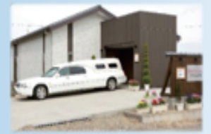
ダビアスリビング新潟南