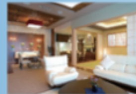
ダビアスリビング県央